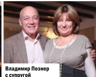
Владимир Познер с супругой