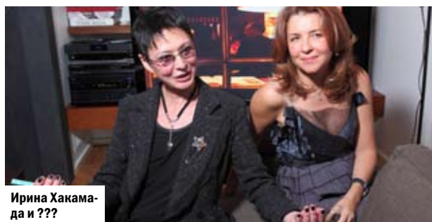
Ирина Хакамада и ???