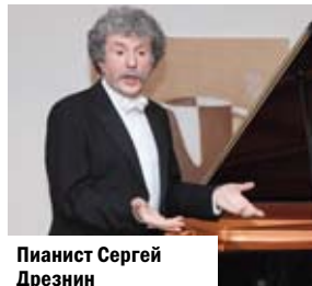
Пианист Сергей Дрезнин