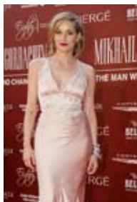
Ведущая вечера Шэрон Стоун